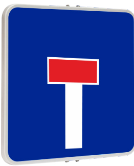
CALZADA SIN SALIDA