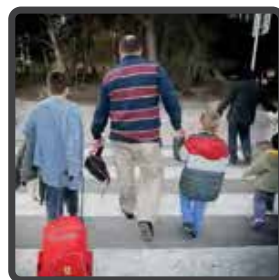
Máxima protección en zonas de riesgo.