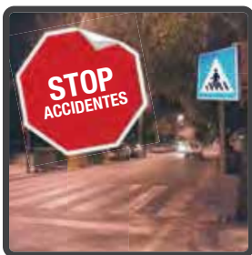
Máxima visibilidad nocturna.