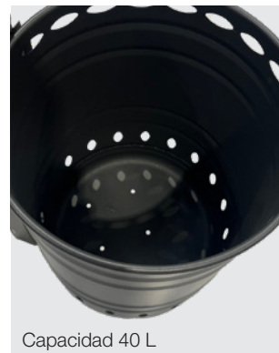
Capacidad 40 L