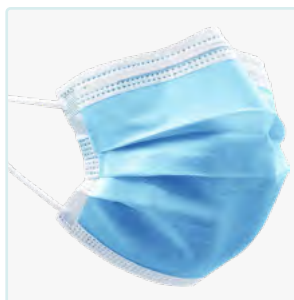
MASCARILLA QUIRÚRGICA TIPO IIR