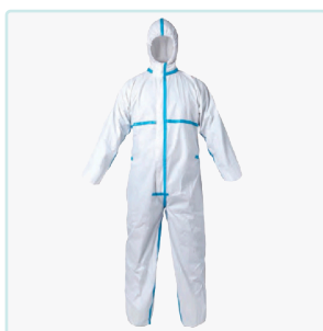
BUZO IMPERMEABLE CAT.III 3B-4B