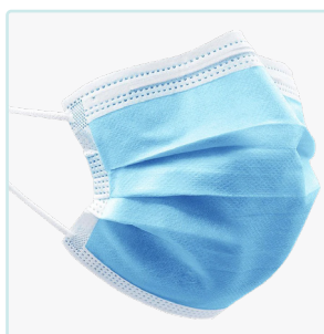
MASCARILLA QUIRÚRGICA TIPO IIR