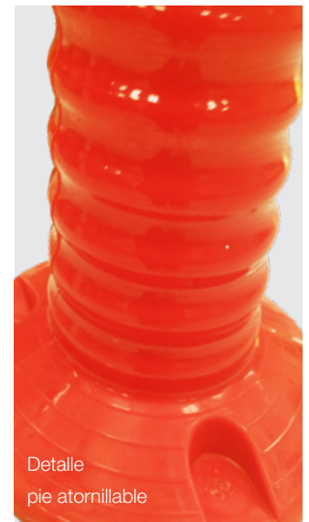
Detalle pie atornillable